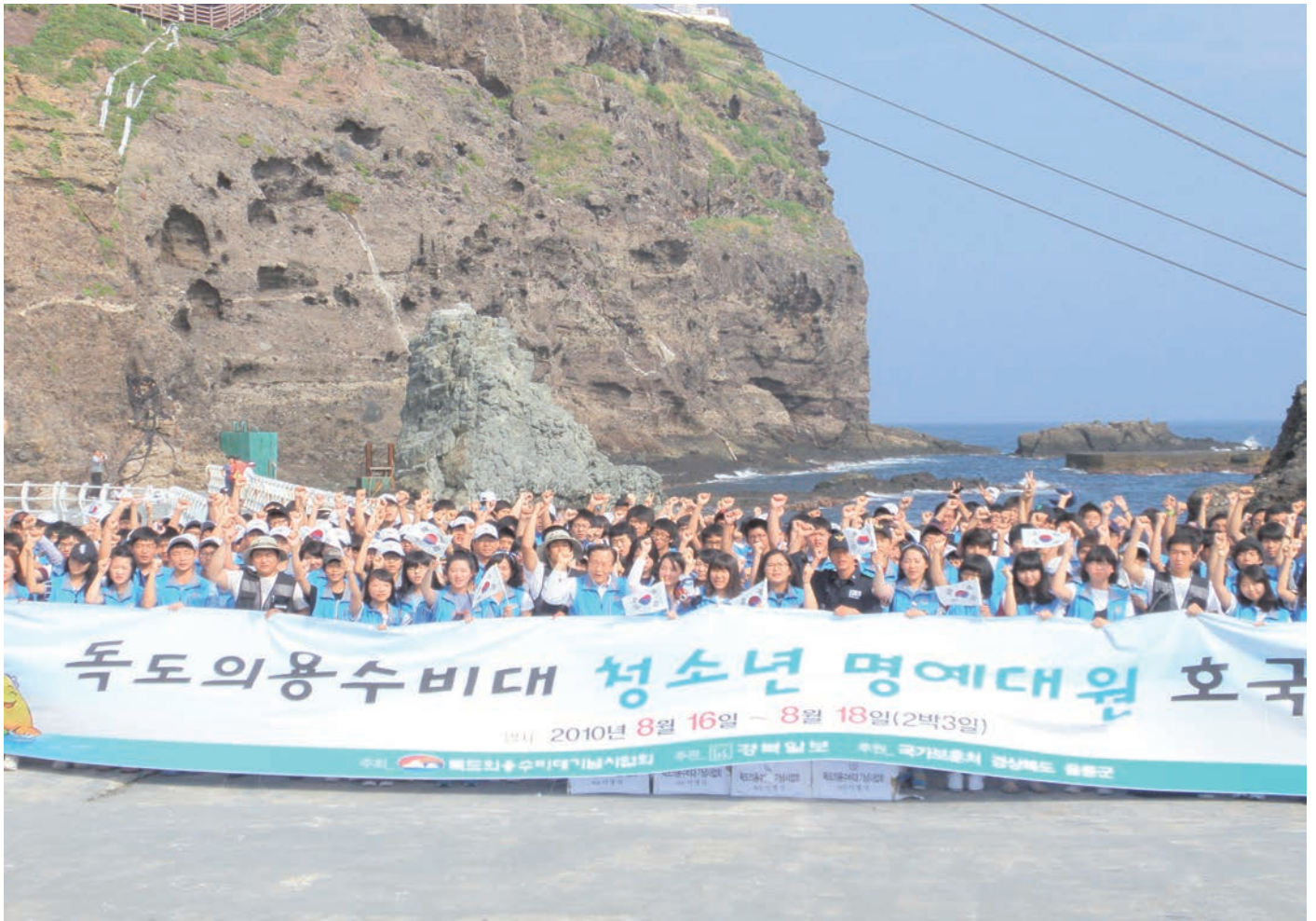
독도사랑(독도의용수비대 청소년 명예대원)