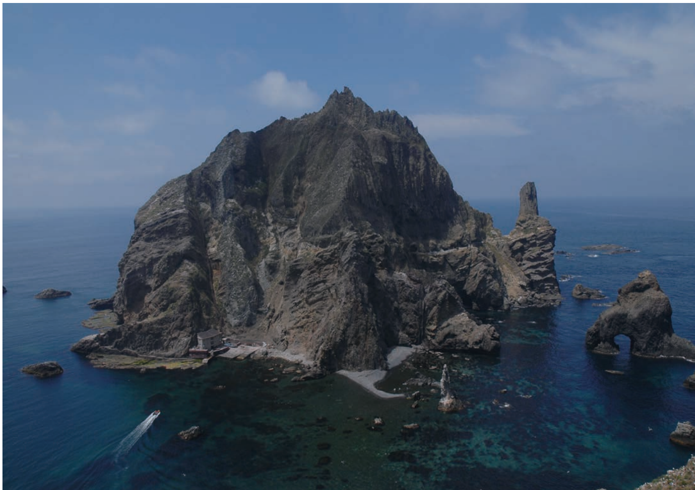
특수임무수행자회 경북지부 제공